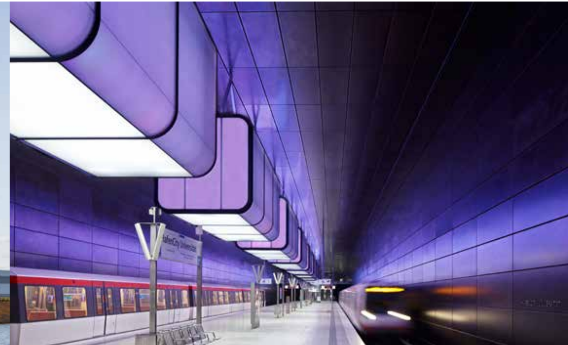
Lichtcontainer | Haltestelle HafenCity Universität | Hamburg | ca. 250 m² | Fini Curve VSG