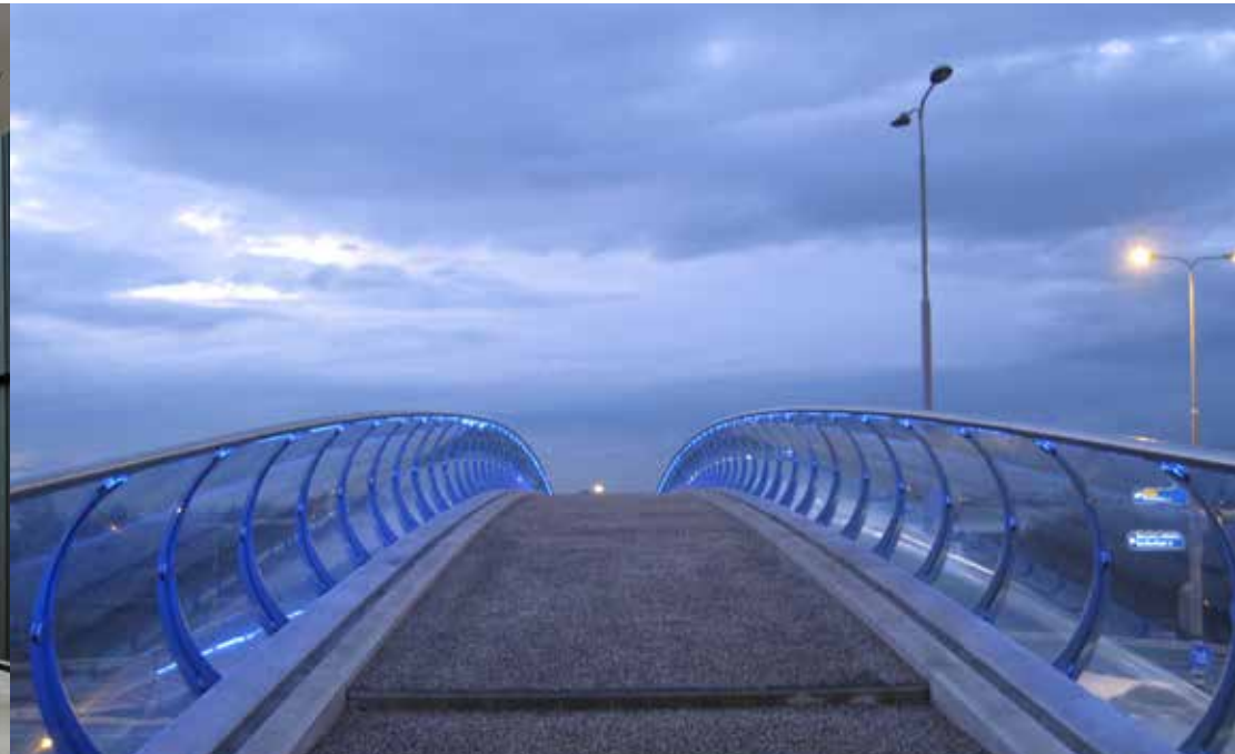
Fußgängerbrücke | Bleiswijk | 150 m² | Fini Curve VSG 66.4 / FLOAT