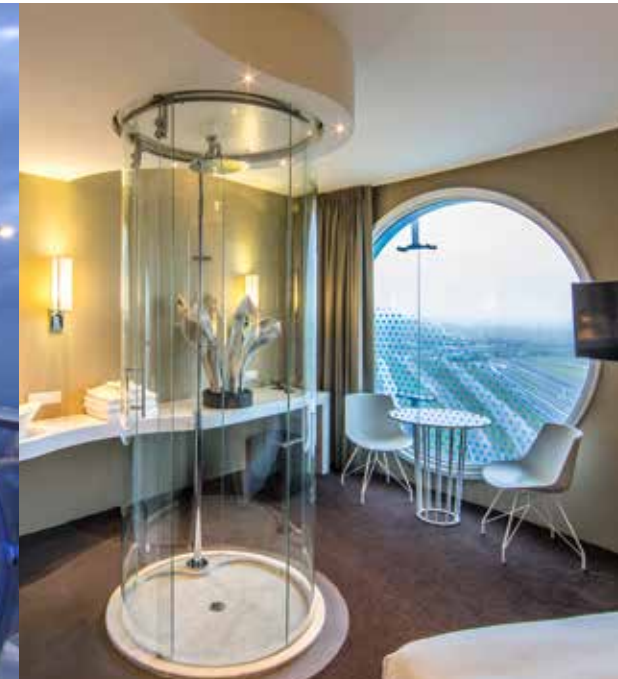
A2 Hotel | Amsterdam | ca. 1600 m² | Fini Curve VSG